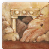
avec entrée dans la grotte