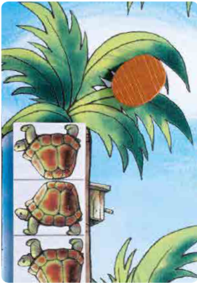
bonne hauteur !